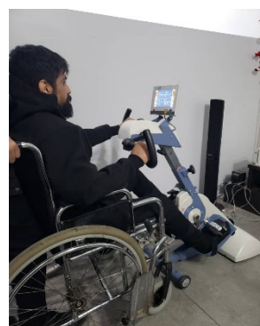
日本から届けた訓練機器

・障害者の皆さんは家族や仲間と一緒に誕生会やボッチャ大会、夜の音楽会を開き、地域のバザーにも出かけ ています。障害者が参加する劇団を作り、楽しく地域活動を行い市民と一緒に活動を広げていきます。