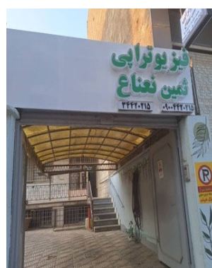
素敵な入口の看板

「スタッフの皆さんも優しくいい感じです」「ミントセンターでミントデイをまたみんなでやって楽しみたい」