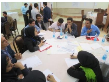
キャラジ市でバリアフリーWS