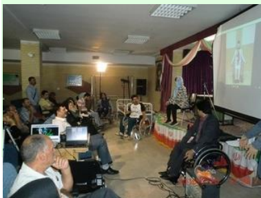
ミント体操を障害者と実施

日本のホームケア専門家とスタッフがイランを訪問、テヘラン脊損協会やアルボルズ州福祉省で床ずれ予防の専門的なワークショップを行い、車いす体操やゲームを行いました。また障害者の自宅を 7 件訪問し床ずれ予防やリハビリの方法を指導し、本人や家族の話を伺い相談活動を行いました。