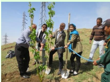
バゲスタン公園の記念植樹

日本のバリアフリー専門家とスタッフがイランを訪問、キャラジ市・テヘラン市・シーラーズ市の行政担当者に専門的なワークショップを行いました。公園の施設設備や歩道の整備について障害者も参加し体験を通してバリアフリー技術を研修しました。また、障害者団体と一緒に親子で障害教育研修を 2 か所で行い障害者の困難を伝え、かかわりの大切さを伝えることができました。