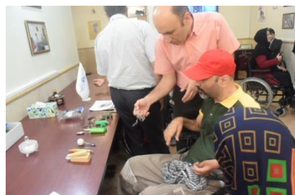
福祉用具を展示して情報提供