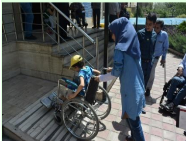
モハームの会と障害教育研修