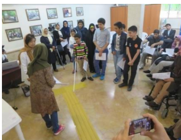
テヘラン脊損協会で障害教育研修