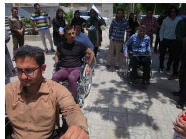
シーラーズ市でバリアフリーWS